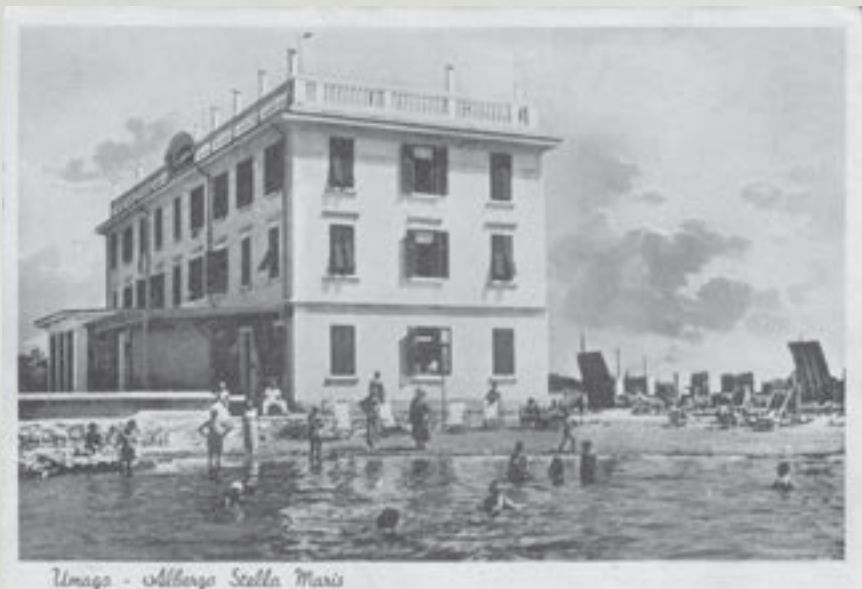
Umago - Albergo Stella Maris