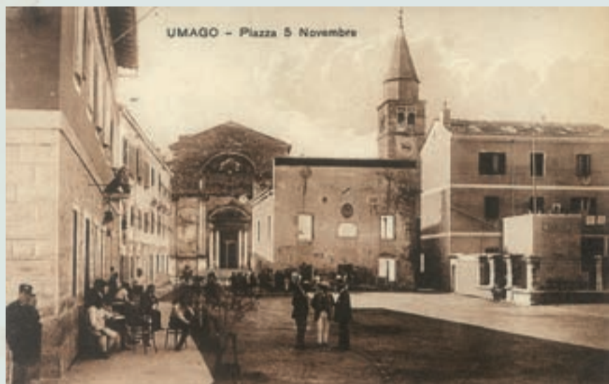
UMAGO - Piazza 5 Novembre