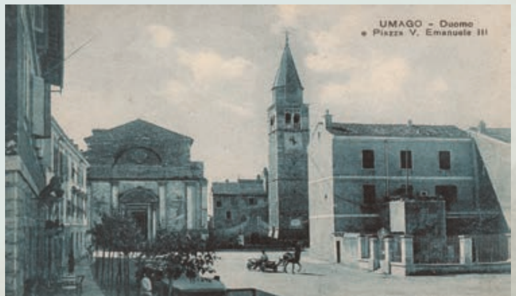
UMAGO - Duomo e Piazza V. Emanuele III